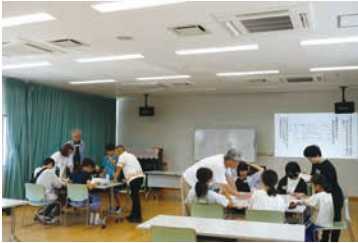
2025年8月3日 詩作ワークショップ

今回の第10回には、304篇の応募があり、ぼうしの詩人賞（最優秀賞）1篇、優秀賞4篇、館長賞4篇が選ばれました。