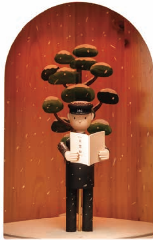
「生ひ立ちの歌」少年期