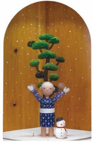
「生ひ立ちの歌」幼年期