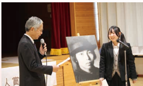
2025年12月6日 10周年記念朗読会