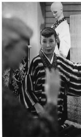
宇野千代 [第3期展示]