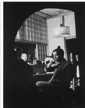
河上徹太郎 [第2期展示]