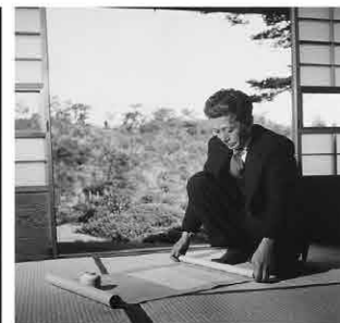
小林秀雄 [第2期展示]